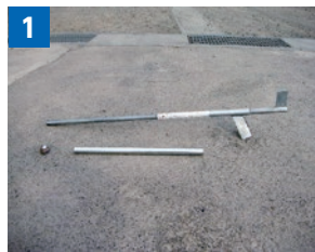
作業開始前に装着されているコロを取り外します