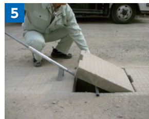
コロを挿入します