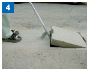
テコ作用でフタを持ち上げます