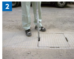
楽々棒を側溝のフタのすき間に挿入します